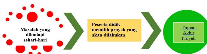
Gambar 3. Karakteristik Pembelajaran Berbasis Proyek

dengan potensi lokal yang menjadi ciri khas SD Negeri Taro'an 1, capaian operasional pembelajaran, dapat pula mengakomodir keragaman minat bakat peserta didik dan mampu mengembangkan kecakapan hidup peserta didik. Penguatan Profil Pelajar Pancasila terdiri dari enam dimensi yaitu beriman, bertakwa kepada Tuhan Yang Maha Esa dan berakhlak mulia, berkebhinekaan global, gotong royong, mandiri, bernalar kritis dan kreatif.