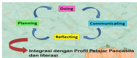
Gambar 2. Alur Pelaksanaan Pembelajaran

Rencana pembelajaran bersifat reflektif. Kontinuitas pembelajaran dapat terlihat dengan harapan tidak terjadi gap dan miskonsepsi dari pembelajaran sebelumnya. Pembelajaran dapat disusun mingguan yang tertuang ke dalam jadwal pembelajaran mingguan, namun catatan refleksi menjadi tambahan dalam kegiatan pembelajaran selanjutnya.