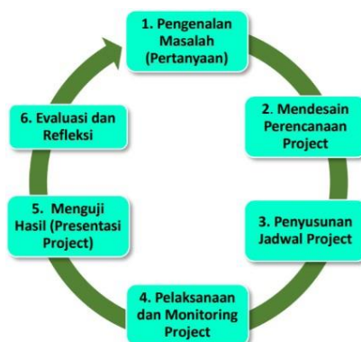
Gambar 4. Langkah-langkah pembelajaran berbasis proyek

Dalam membuat rancangan pembelajaran berbasis proyek terdapat langkah- langkah yang harus disusun secara bertahap mulai dari mengidentifikasi masalah dengan pertanyaan pemicu yang diambil dari permasalahan kontekstual implementasi Profil Pelajar Pancasila kemudian merancang proyek secara kolaboratif antara guru dan peserta didik disertai program penjadwalan yang disepakati, setelah itu dilanjut ke tahap pelaksanaan. Di bagian akhir ada presentasi hasil yang akan dievaluasi dan kemudian menjadi refleksi untuk perbaikan.